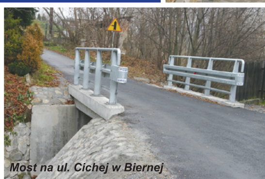
Most na ul. Cichej w Biernej