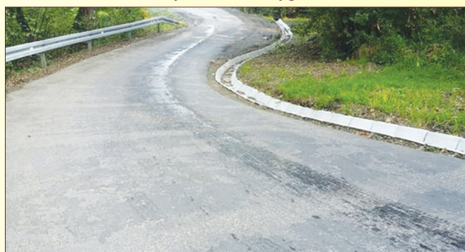
ul. Porzeczkowa w Pietrzykowicach