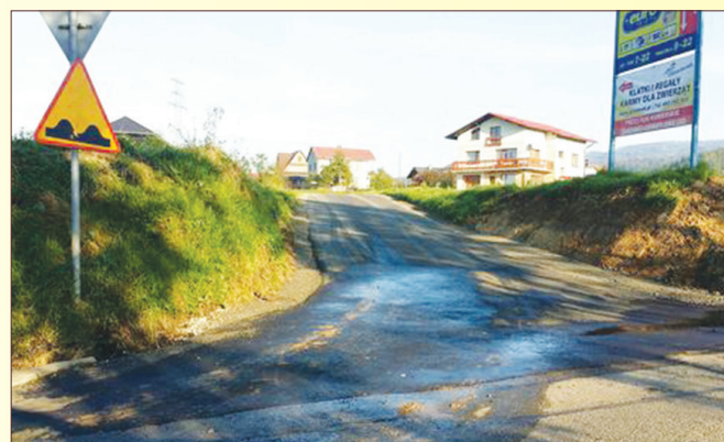
Zjazd na ul. Rolniczą w Biernej