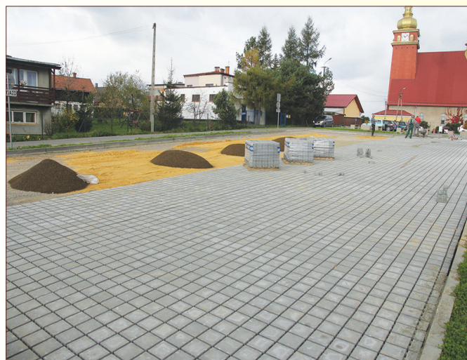
Budowa parkingu przy kościele w Pietrzykowicach

Mając na uwadze liczne prośby mieszkańców oraz dzięki pozyskanym środkom z Unii Europejskiej do połowy listopada powstaną dwa nowe parkingi: obok Ośrodka Zdrowia w Łodygowicach oraz koło Przedszkola w Pietrzykowicach. Wyremontowane zostaną parkingi przy kościele w Zarzeczcu oraz położona zostanie kostka betonowa na obecnie żwirowym parkingu koło kościoła w Pietrzykowicach. Łączny koszt inwestycji to 230 tys. zł.