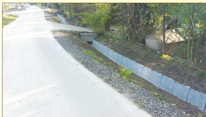
ul. Nowy Świat w Łodygowicach