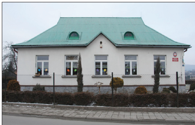
Budynek przedszkola obecnie

W ramach zadania przewiduje się dobudowę do istniejącego budynku przedszkola nowych pomieszczeń oraz adaptację części pomieszczeń obecnie wykorzystywanych przez przedszkole na potrzeby klubu dziecięcego. Celem inwestycji jest uzyskanie powierzchni dla nowego klubu dziecięcego, działającego w oparciu o ustawę z dn. 4 lutego 2011 r. o opiece nad dziećmi w wieku do lat 3, przy założeniu powstania min. 45 miejsc dla dzieci w wieku do lat 3.