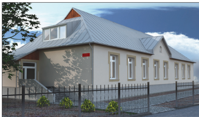
Przedszkole i Klub Dziecięcy po rozbudowie

Gmina Łodygowice jako jedyna w powiecie żywieckim złożyła wniosek do Resortowego Programu „Maluch” i otrzymała dotację w wysokości 228 000 zł na utworzenie klubu dziecięcego na 45 miejsc. Projekt zakłada utworzenie największego w Polsce klubu, spośród wszystkich ofert złożonych w ramach konkursu. Klub powstanie przy przedszkolu nr 1 im. Ottona Klobusa w Łodygowicach.